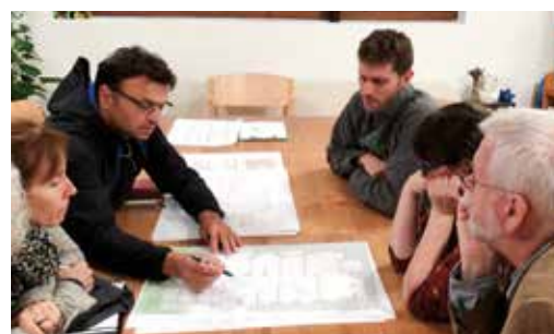
Besprechung mit den Architekten betreffend dem Ablauf Sanierung Haus Guggenbühl.