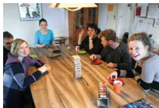
Gemütlicher Spielnachmittag am Sonntag.

Die Wohngemeinschaft Akazienhaus gibt uns Einblick in ihren Alltag: