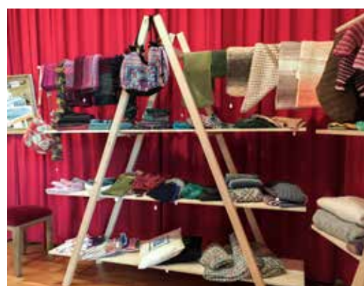
Verkaufsausstellung am Winterbazar.

Herzlichen Dank für Ihre Unterstützung! Für Fragen oder Anregungen stehe ich gerne zur Verfügung.