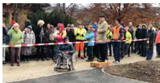
Feierliche Parkplatzöffnung am 29. Nov. 2019

Testphase beobachten wir, ob sich die Pollerleuchten auch für den Gehweg eignen würden und wir eventuell auf die eigentlich geplanten «Strassenlaternen» verzichten und somit einiges an Ausgaben einsparen könnten.