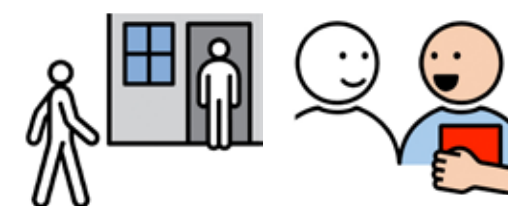
Metacom-Symbole für «Besuchen» und «Danke»