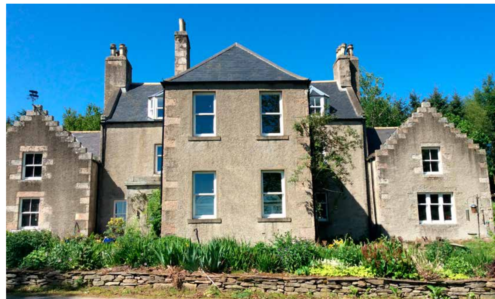
Camphill Community for children in need of special care, Camphill, Aberdeen, Scotland

Noch vor 30 Jahren zeigte sich der Camphill-Gedanke an sichtbaren strukturellen Äusserlichkeiten. In einer Camphill Dorfgemeinschaft lebten und arbeiteten begleitete Menschen zusammen mit den BetreuerInnen in einer wirtschaftlichen Gemeinschaft. Heute hat sich das Äussere verändert – Camphill lebt vom inneren Gedanken.